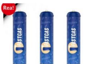
Rea! Skärmdump från lustgasförsäljare på nätet

Syftet med nyhetsbrevet är att informera och stötta dig i arbetet att hindra våra barn och unga från att börja använda tobak, alkohol eller andra droger. Du kommer att få information om vad som händer i kommunen med omnejd, intressanta fakta och tips om forskning m.m.