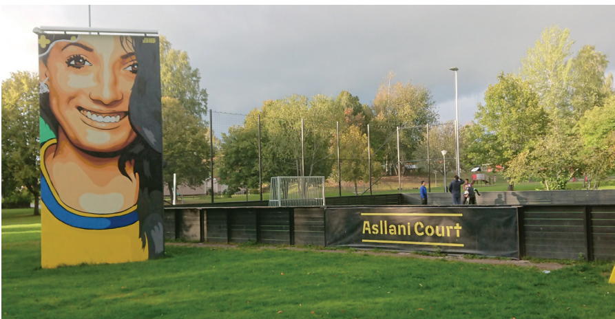
Asllani Court, 2018. Målning av John Beijer.

Vimmerbys första ålderdomshem, idag förskola