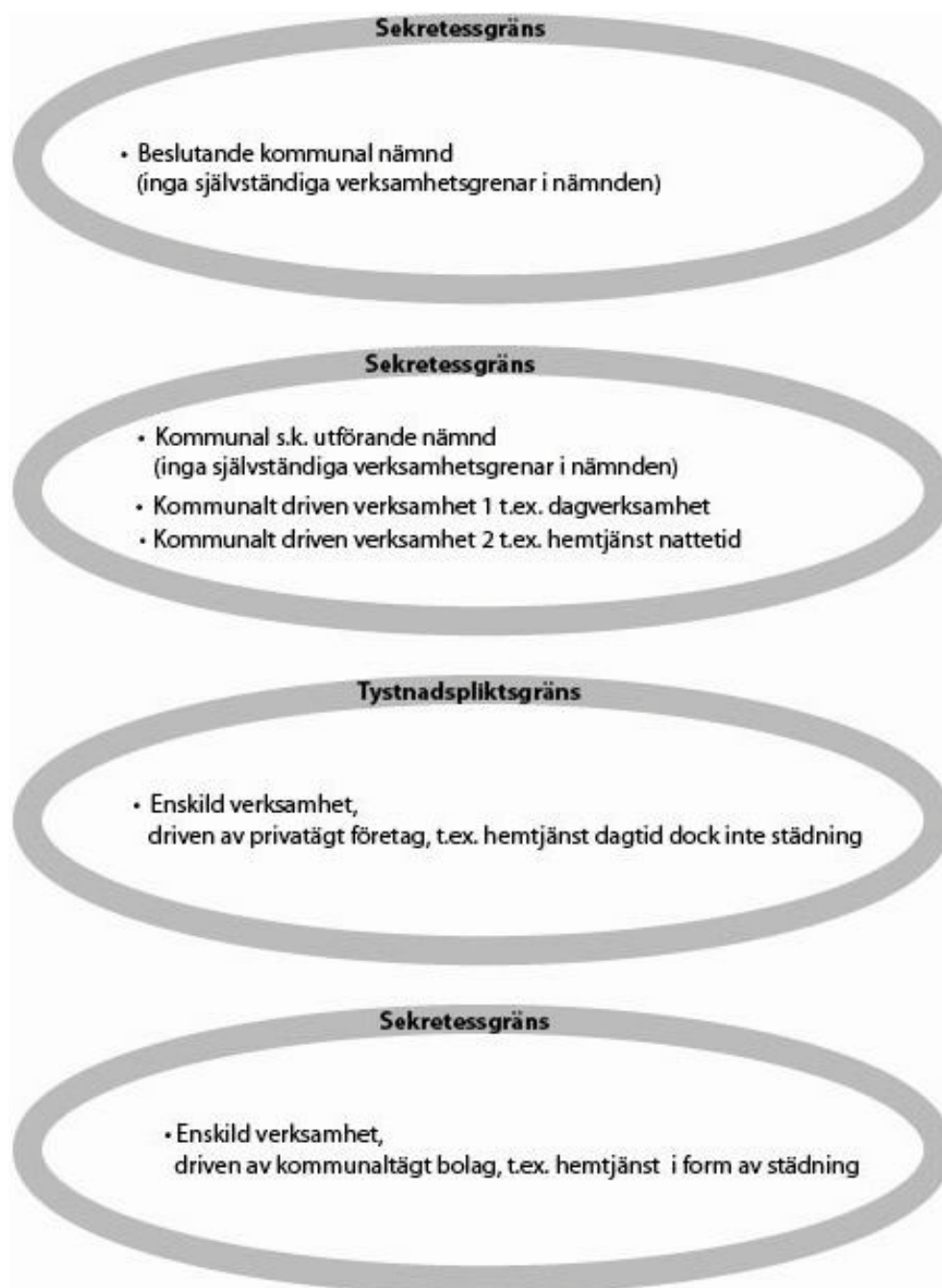
Figur 2. Exempel som visar var det finns sekretess- samt tystnadspliktsgränser för uppgifter inom socialtjänsten