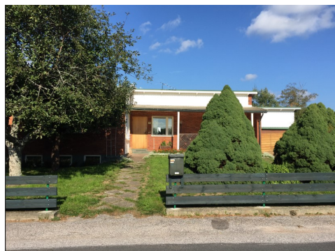
Funktionalistiska villor med pulpettak längs Lantmannagatan.