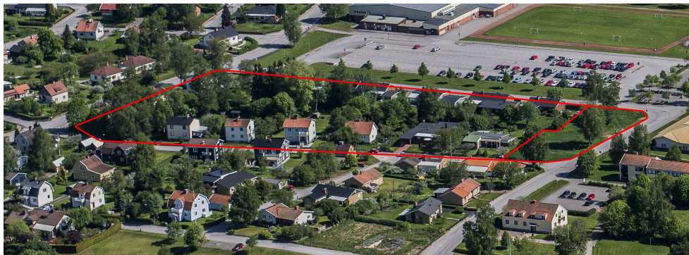
Flygfoto över bostadskvarteret Konvaljen.

De fåtaliga bilarna som fanns under detta decennium betraktades inte som ett problem, alla gator var öppna för rundkörning. Kvarteret Konvaljen kan man köra runt Lantmannagatan, Skyttegatan, Kungsgatan och Jägaregatan.