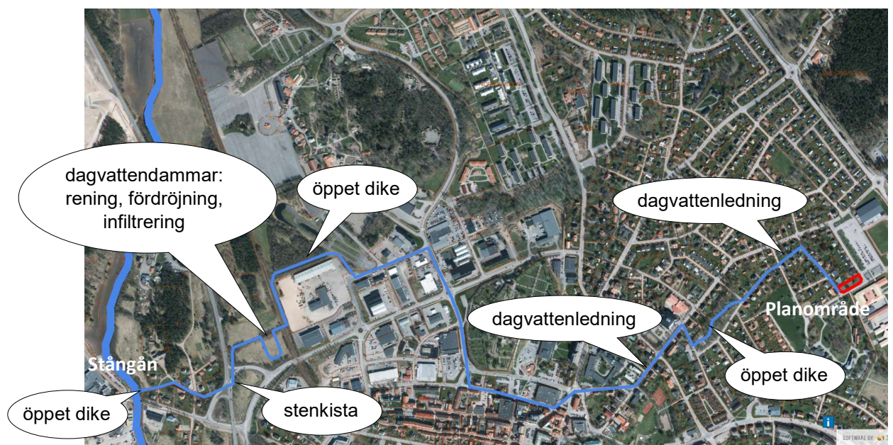
Karta över dagvattnets väg från planområdet till recipienten Stångån.

De nya lucktomterna ska kopplas på befintligt dagvattensystem eftersom de ligger i detaljplanelagda områden som redan idag ingår i VA-huvudmannens verksamhetsområde för VA.