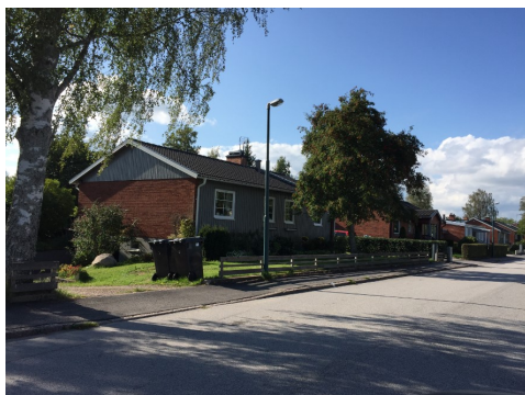
Rektangulära villor i brunt tegel längs Jägaregatan.

Gällande detaljplan tillåter friliggande hus eller parhus i två våningar, därutöver tillåts inredning av vind samt källare. Maximal bygghöjd på 7,6 meter. Byggrätten är 20% av fastighetsytan. Fastigheternas storlek varierar mellan 900-1100 m 2 . Flera fastigheter har byggnadsareor över 250 m 2 .