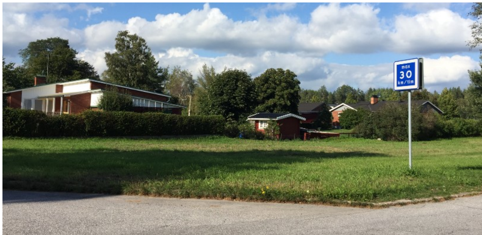
Planområdet från gatukorsningen Lantmannagatan/Skyttegatan.

Området är flackt och består av iordningställda gräsytor som är be vuxna med enstaka björkar.