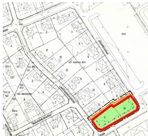
Gällande detaljplan 08-VYS-343

I tidigare detaljplan 08-VYS-178, lagakraftvunnen 1946, angav bostäder för området planlagt för bostäder och var en del av bostadskvarteret Konvaljen.