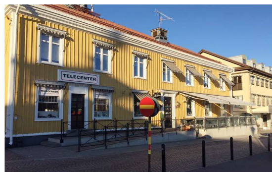
Bakfickan – Göken 1 Stensatt uppbyggnad cirka 1 meter.