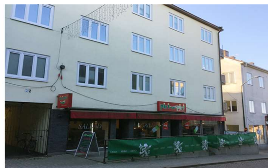
Piri-Piri – Trasten 1 Stensatt uppbyggnad cirka 90 cm.