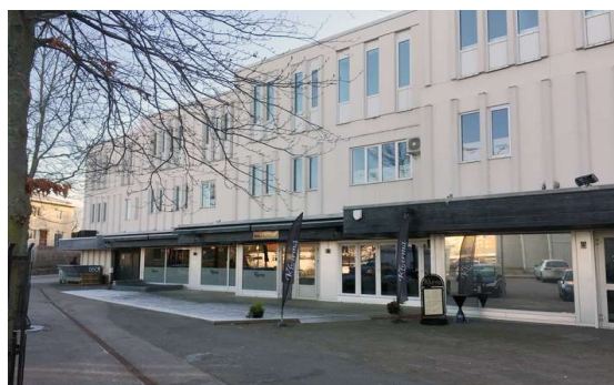
Kharma – Falken 2 Trärall uppbyggd.

Befintliga fasta anordningar för uteserveringar