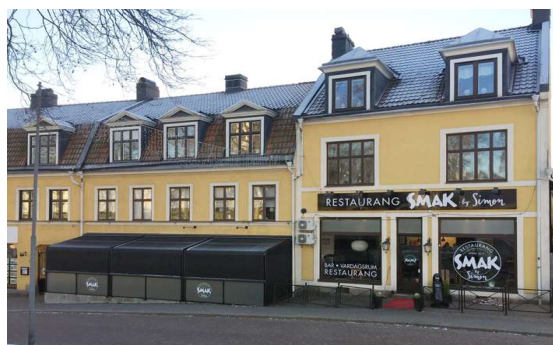
Smak – Måsen 2 Stensatt uppbyggnad med skärmtak.