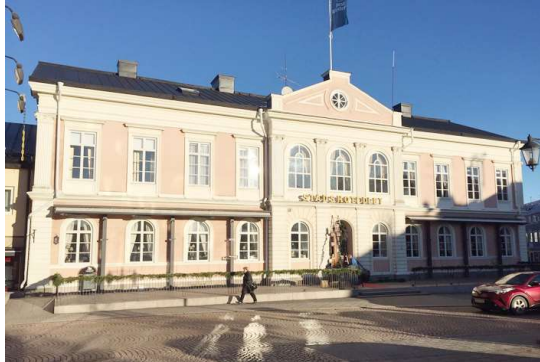
Stadshotellet – Pelikanen 7 Stensatt uppbyggnad, 80 cm som högst.