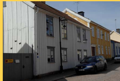
Rådmansgården Storgatan 28