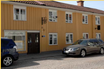
Grankvistgården Storgatan 32