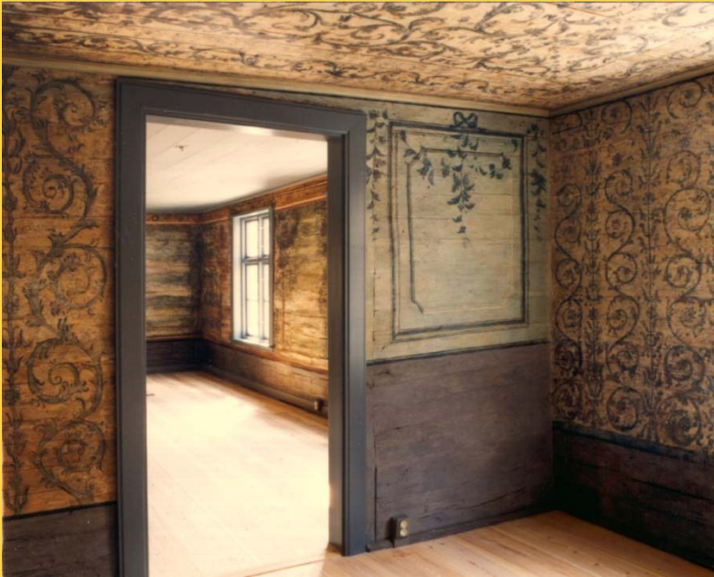
Sydvästra rummet. Dörr mot salen.

Ursprungligen målades väggarna barockstil någon gång under 1700-talets början. Under senare delen av 1700-talet målades dock väggarna över med fältindelade målningar i gustaviansk stil. Dessa målningar kom sedermera att befinna sig i ett mycket dåligt skick.