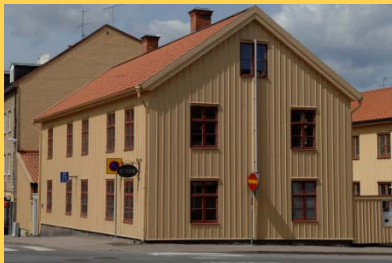
Näktergalen Sevedegatan 43