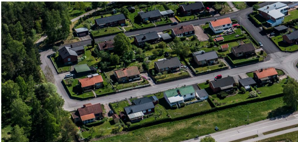
Flygfoto över kvarteren Solrosen, Oxeln och Nejlikan.

De intilliggande bostadskvarteren Solrosen, Oxeln och Nejlikan uppfördes av Gullringshus under en expansiv tid. Kvarteren består av tidstypiska enplansvillor med ett källarplan. Husen har röda och gula tegelfasader, ibland kombinerat med puts. På samma fasad finns flera olika fönstertyper; perspektivfönster, enkla tvåluftsfönster och asymmetriska fönster. En del entréer har fortfarande kvar de dekorativa smidesräckena. Taken består av enkla sadeltak med betongpannor utan takkupor.